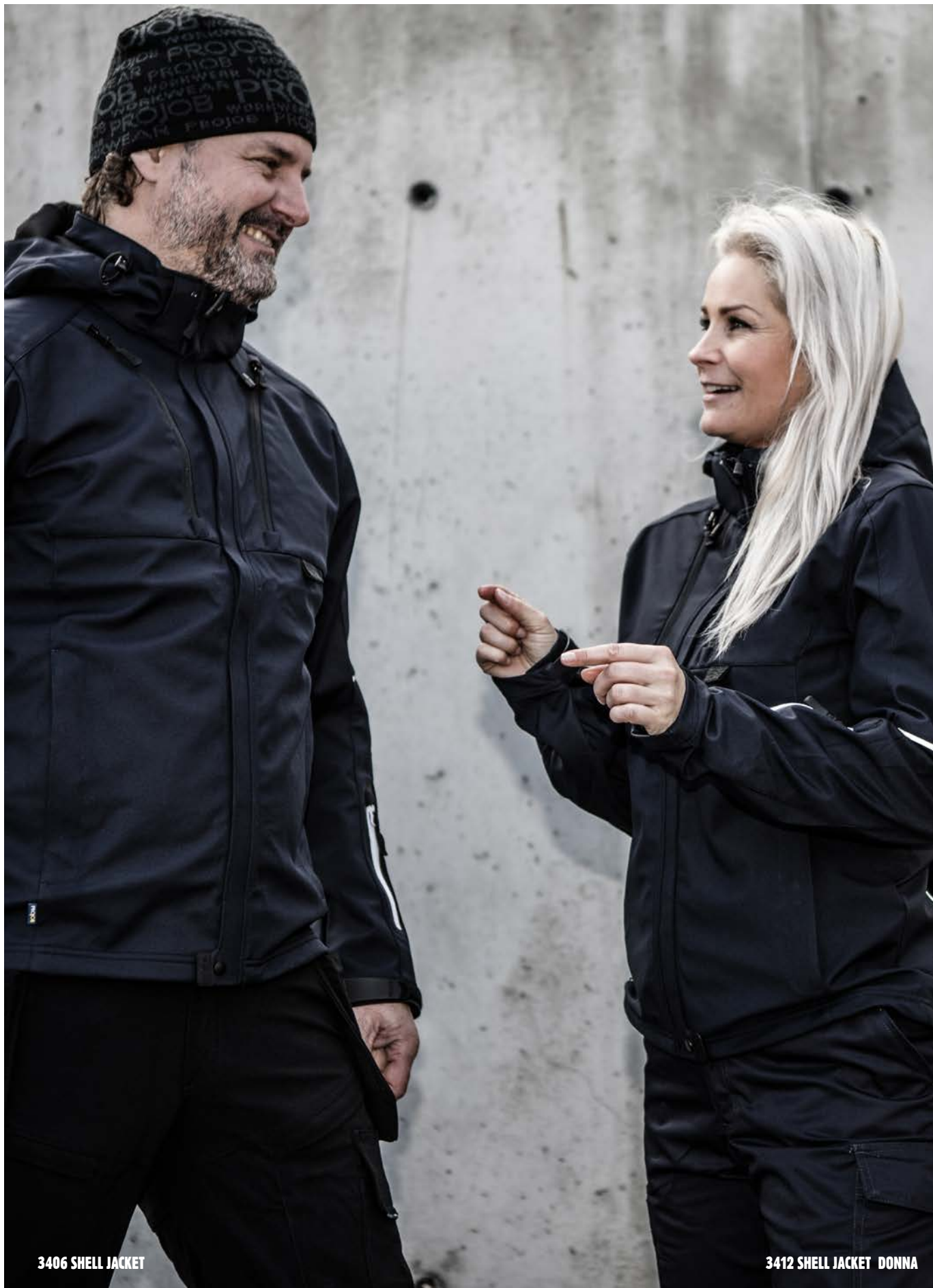
3406 SHELL JACKET