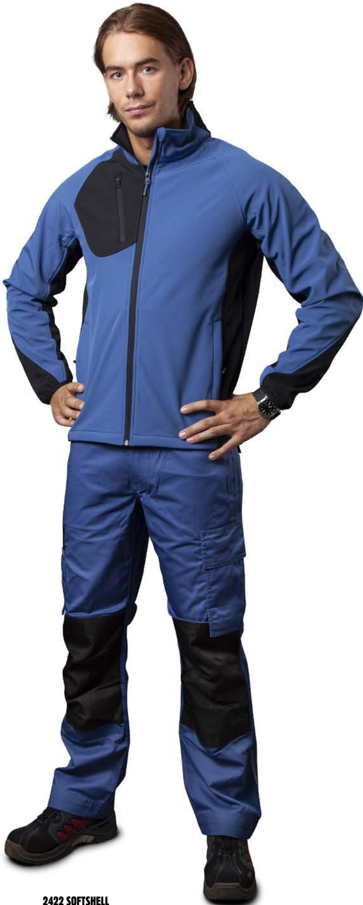
2422 SOFTSHELL 5532 PANTALONI