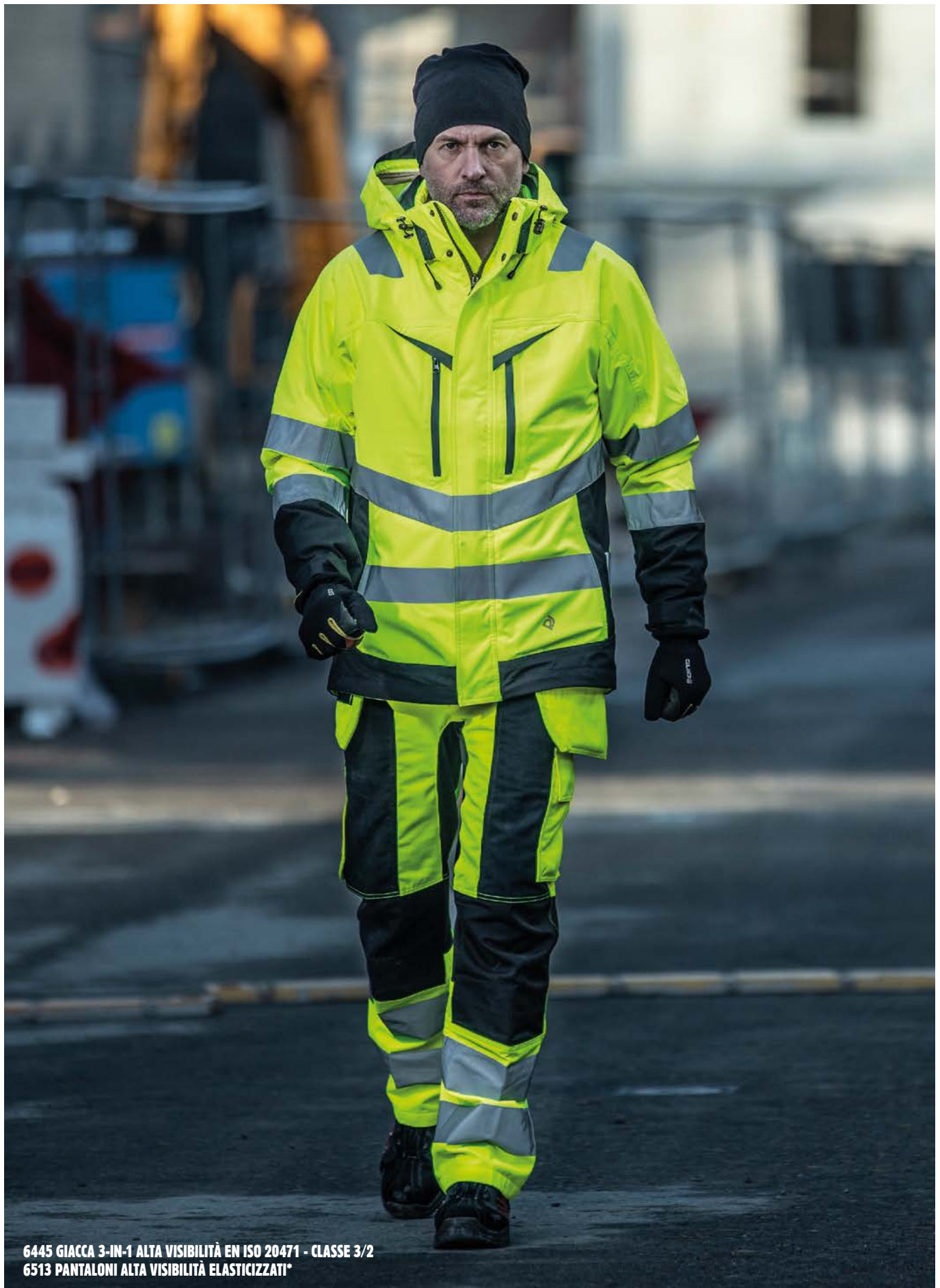
6445 GIACCA 3-IN-1 ALTA VISIBILITÀ EN ISO 20471 - CLASSE 3/2 6513 PANTALONI ALTA VISIBILITÀ ELASTICIZZATI*