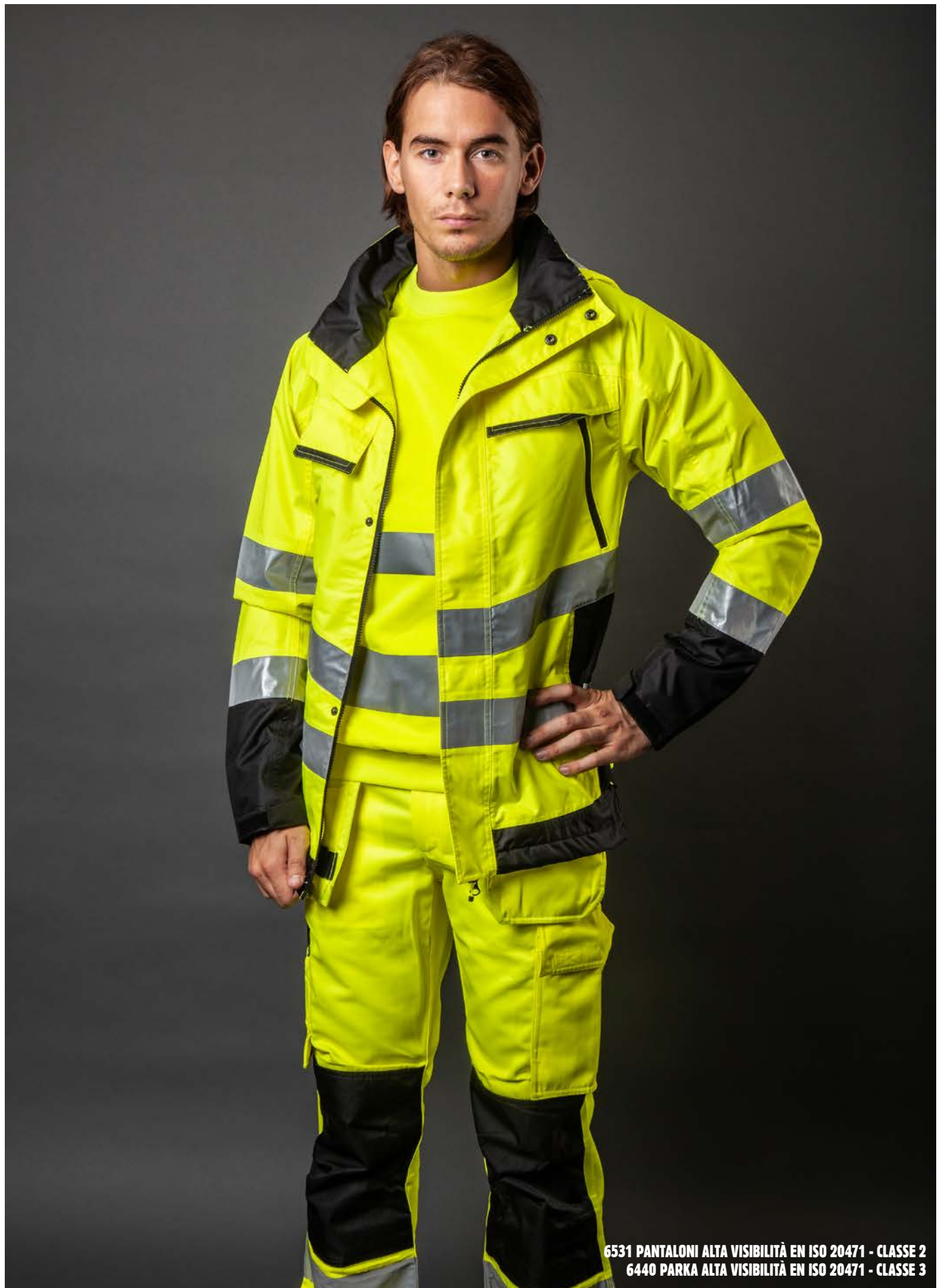
6531 PANTALONI ALTA VISIBILITÀ EN ISO 20471 - CLASSE 2 6440 PARKA ALTA VISIBILITÀ EN ISO 20471 - CLASSE 3