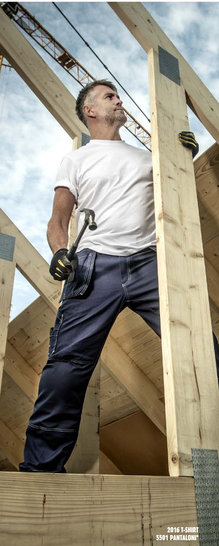
2016 T-SHIRT 5501 PANTALONI*