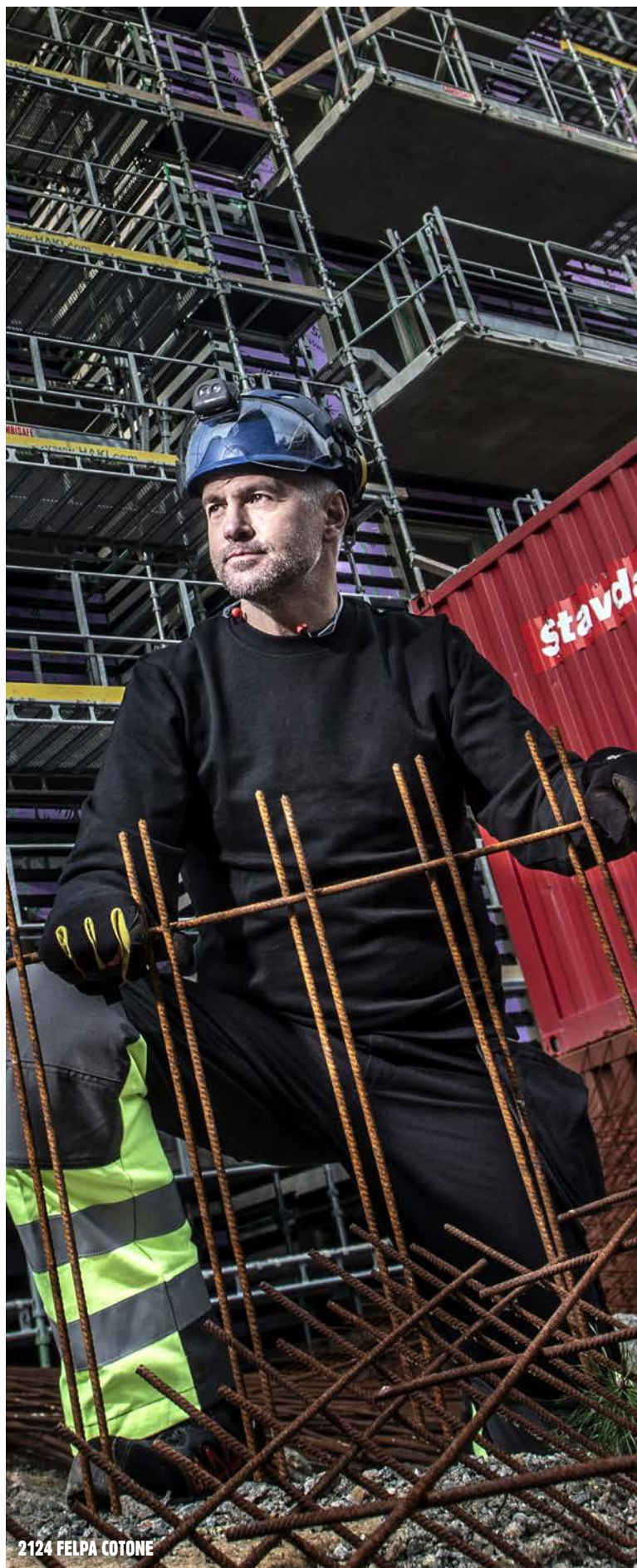
2124 FELPA COTONE