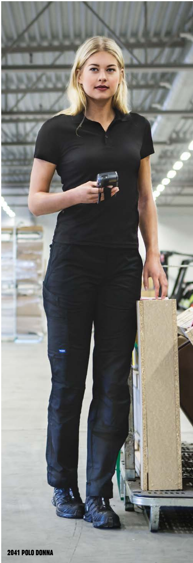
2041 POLO DONNA