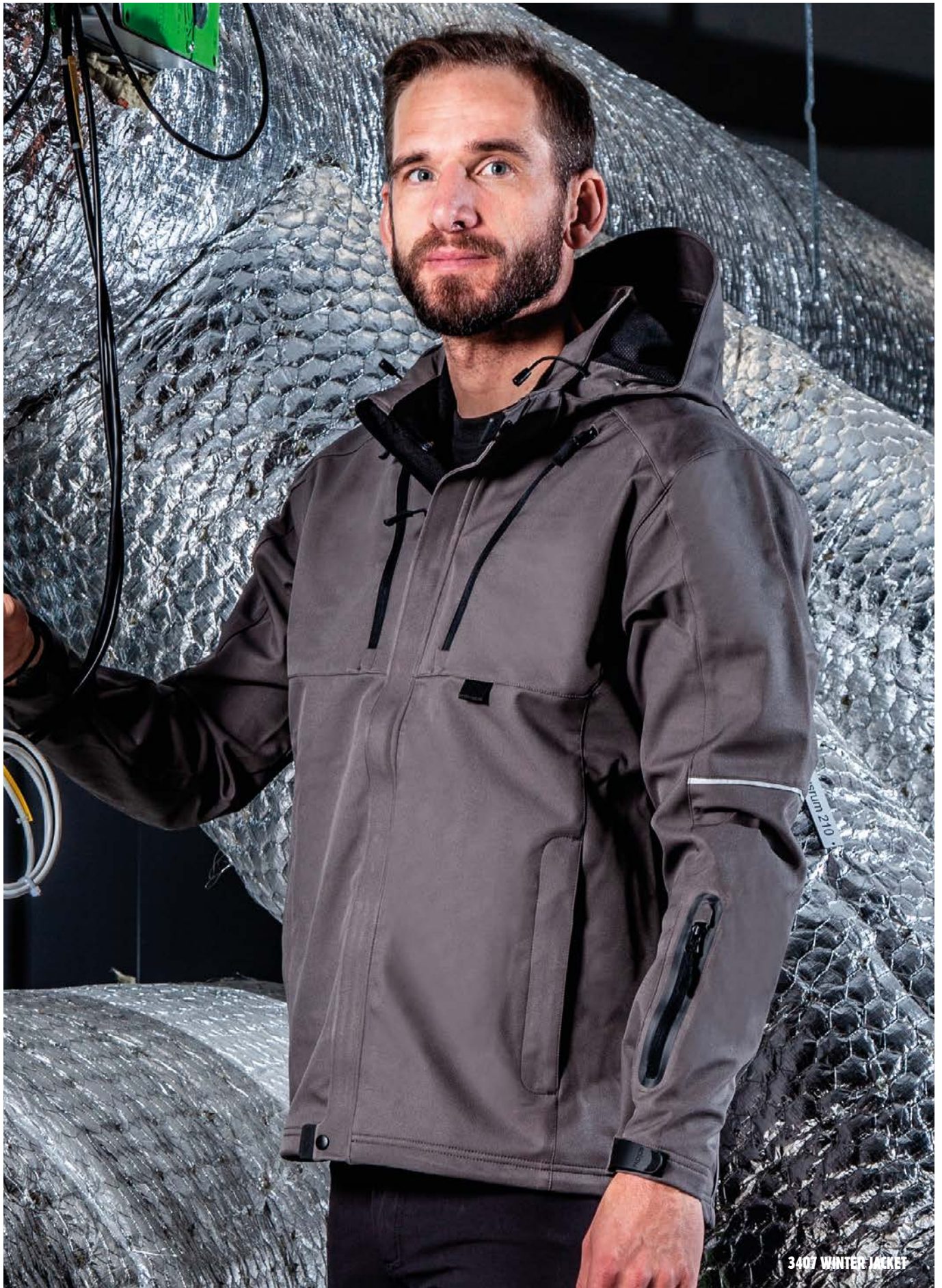
3407 WINTER JACKET