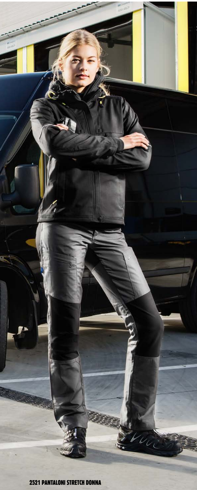
2521 PANTALONI STRETCH DONNA